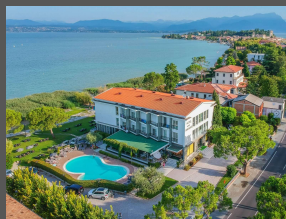
Hotel Miramar, Sirmione